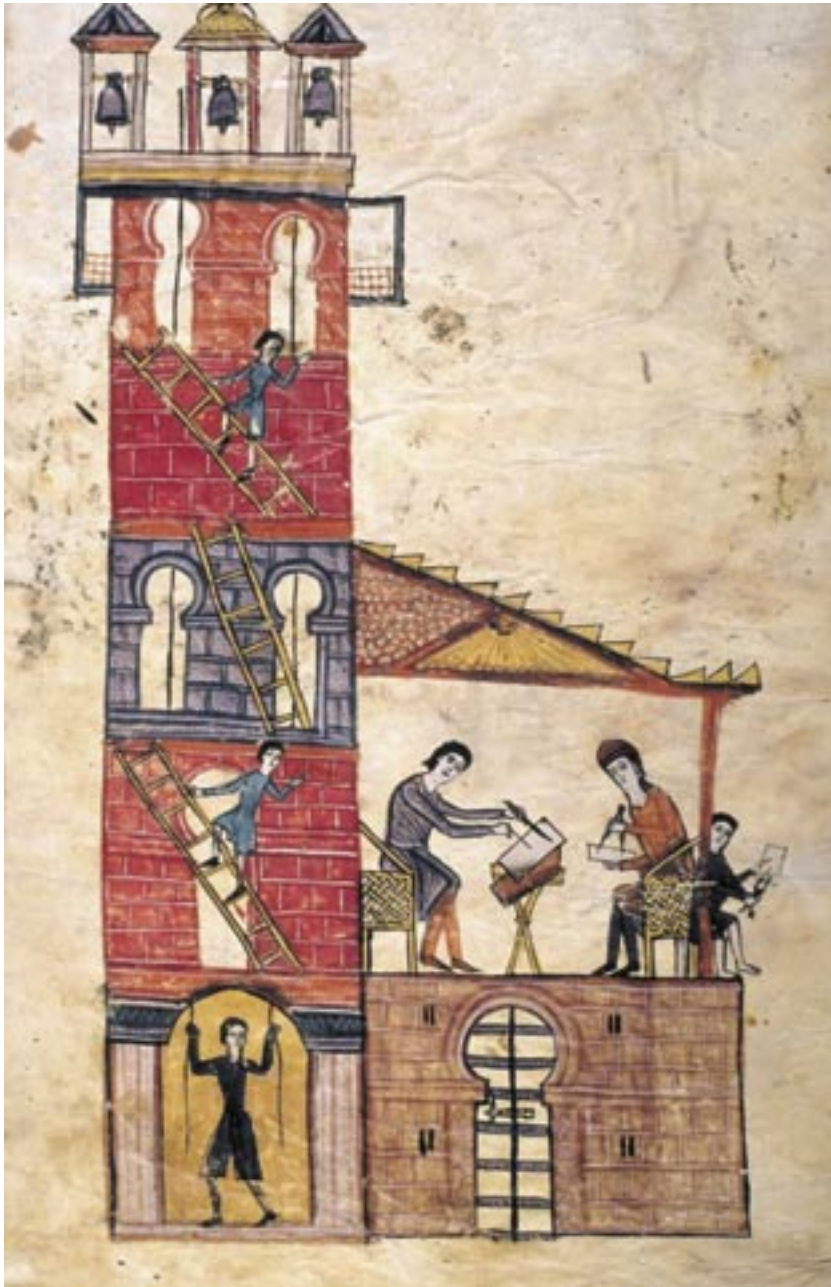
2 DER TURM VON SAN SALVADOR DE TÁBARA